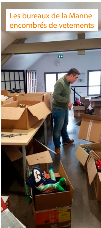
Les bureaux de la Manne encombrés de vêtements