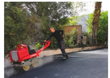
Le résultat presque terminé.