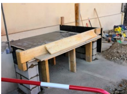
Coffrage du nouveau quai, avant de percer le mur pour la porte sectionnelle.