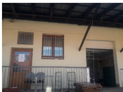
À gauche la nouvelle porte de l'épicerie et à droite le quai avec la nouvelle porte sectionnelle.