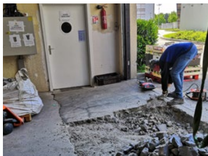
Démontage du plan incliné devant l'ancienne porte sectionnelle avant de la condamner.