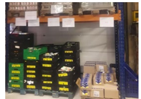
Après avoir refait le béton au sol, nous avons monté un rack devant l'ancienne porte.