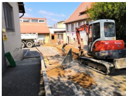
Gros chantier devant les bureaux pour créer la zone stationnement handicap.